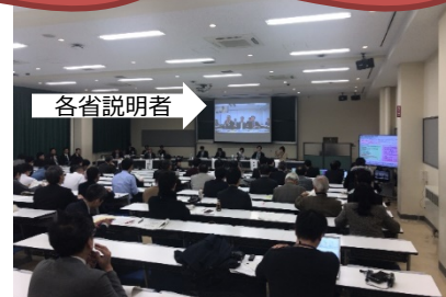
※写真は昨年の秋のレビュー実施時のもの（山形県において実施）