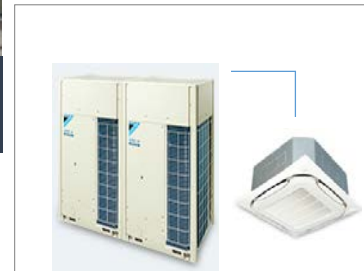
高効率エアコン (ベトナム) エアコン: 三菱製