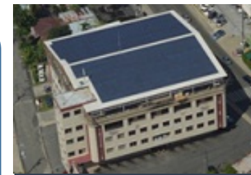
太陽光発電 (パラオ) 太陽光パネル: 京セラ製

(※) モンゴル、バングラデシュ、エチオピア、ケニア、モルディブ、ベトナム、ラオス、インドネシア、コスタリカ、パラオ、カンボジア、メキシコ、サウジアラビア、チリ、ミャンマー、タイ