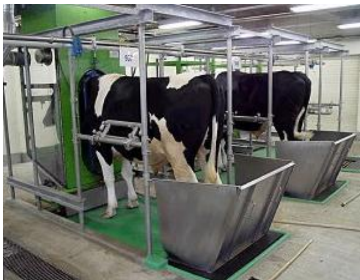
乳用牛を用いた代謝試験